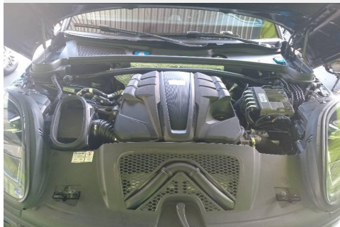
COMPARTIMENTO DO MOTOR